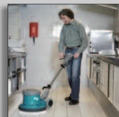
Maskinen i drift