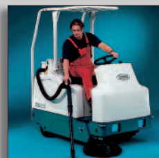
Skyddstak och handsug