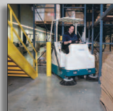
Maskinen i drift