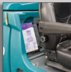
Integrerat 4L FaST-PAK