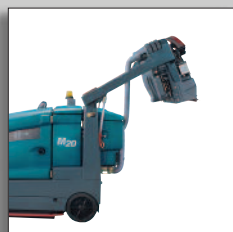
Variabel hög tömning