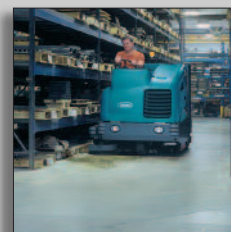
Maskinen i drift