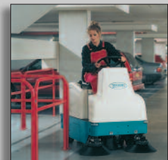
Maskinen i drift