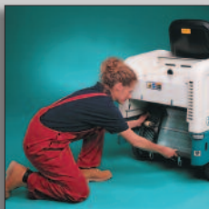
Filter kan bytas utan verktyg